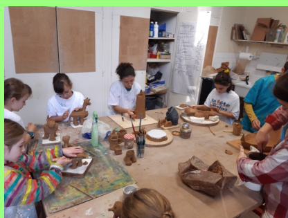
Terre & Modelage

ENCADREMENT : Les ateliers d'Isoline sont toujours aussi prisés et les Ateliers ponctuels complets.