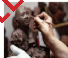
Expo Terre et Volume