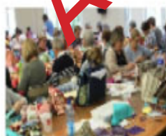
Journée de l'Amitié Le 20 de 9h30 à 16h30