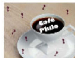
Café Philo Le 21 de 10h à 11h30