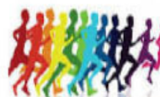
Cross déguisé et Carnaval des enfants Le 22 à 10h