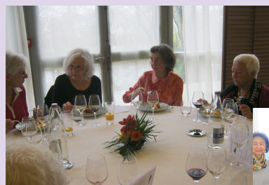
à gauche et en bas le repas au Lycée Appert

>> BILLETTERIE : 8 € Places pour les spectacles en journée en prévente au 06 86 41 62 02 ou par mail a.chasles@apajh44.org Billetterie sur place en quantité limitée. Gratuit pour les accompagnateurs de personnes en situation de handicap