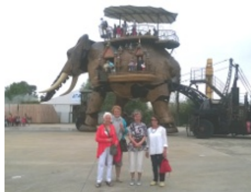
Les z'Aînés au Voyage à Nantes le 2 juillet

Nous allons donc tester ce nouveau service de covoiturage durant cette fin d'année 2015 à raison d'un rendez-vous toutes les semaines, alternativement le mardi et le jeudi. Nous aurons l'occasion en fin d'année 2015 de faire un premier bilan de ce service, nous en profiterons pour faire quelques ajustements si nécessaire, et nous serons à même de donner les dates des prochains RDV pour le début 2016.