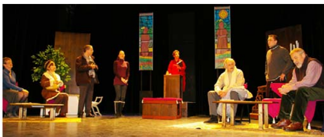
« C'était écrit ! » Février 2010