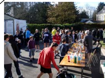
Le Printemps – 21 mars 2010

Tous à l'A. G. ! Samedi 6 novembre 2010 à 10 h 30