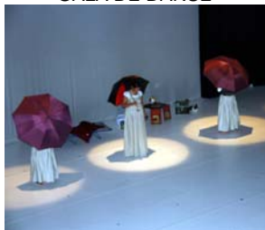
23 juin 2010