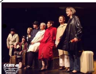
13 mars 2010