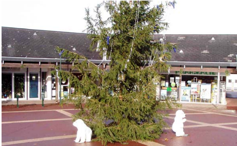
Petit ours blanc était heureux.

Il allait passer tout le mois de décembre avec son copain, petit ours blanc lui aussi, sur la place du Centre Commercial du Bois Raguenet, bien à l'abri sous le sapin.