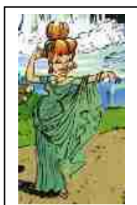
La mode de Lutèce