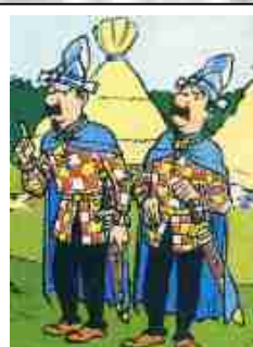
Membres de la Sûreté Gauloise

Voici quelques suggestions d'habillement pour la fête de la Saint Jean 2005... en juin prochain