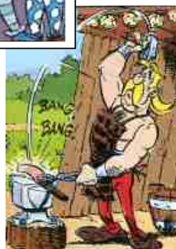
Forgeron : tenue de travail et habits d'apparat