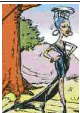
Robe « dolmen du soir »