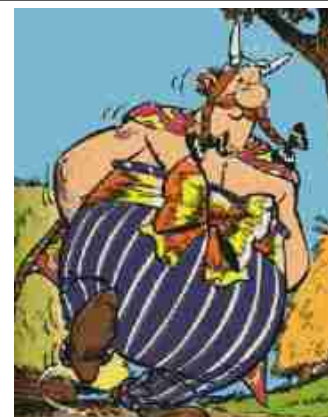
Livreur de menhir parvenu