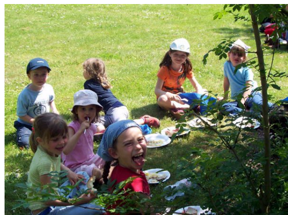
Avec tous mes copains et copines.

Quelques précisions peuvent être apportées pour compléter le récit précédent. Le rallye a eu lieu le dimanche 16 mai, avec pour rendez-vous initial le parking du centre commercial ; le thème annoncé était « la chasse aux papillons ». Le remplissage d'une grille de mots fléchés nous donnait le lieu du parcours pédestre : la Garenne-Lemot, près de Clisson. La petite tour, sujet de la première épreuve, comportait 18 colonnes ; la deuxième épreuve consistait à retrouver le nom d'opéras italiens. La rivière est la Sèvre, et le château « tout démoli », celui de Clisson. Parmi les différentes huiles à reconnaître, il y avait de l'huile de foie de morue. Une « marche » est un barrage de faible hauteur, il fallait en compter 7 sur la Sèvre depuis Clisson jusqu'au terme du parcours.