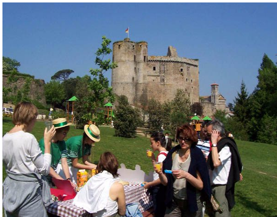
«... des messieurs et des dames en vert nous ont donné du jus d'orange... »