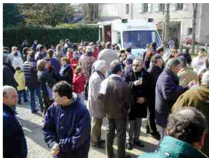
L'apéritif : après le sport, le réconfort !