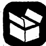
PAPIER / CARTON